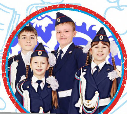
ЮНЫЕ ИНСПЕКТОРА ДВИЖЕНИЯ