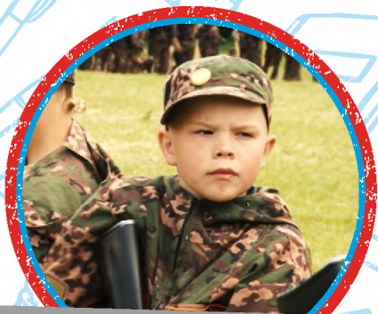
ЮНЫЙ СПЕЦНАЗ НАЦГВАРДИИ