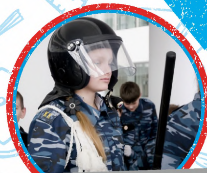
ЮНЫЕ ДРУЗЬЯ ПОЛИЦИИ